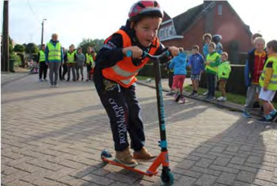
Archiefbeeld Strapdag