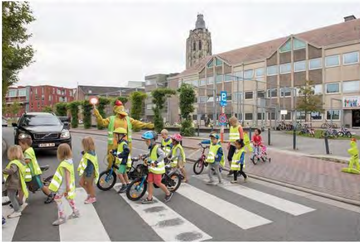
Een gemachtigd opzichter, verkleed in een eend, helpt kinderen oversteken aan de school in Smallendam. - Ronny De Coster

Geen zwaar verkeer meer, beter aangeduide fiets- en voetpaden, snelheidscontroles en verkeer in één richting: dat zijn de eisen die leerkrachten en ouders van kinderen van KBO Sint-Walburga aan de Smallendam kracht bijzetten in een petitie.