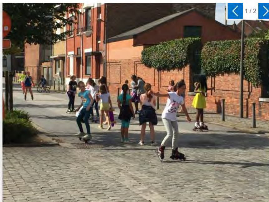
Vandaag in de Rijschoolstraat.