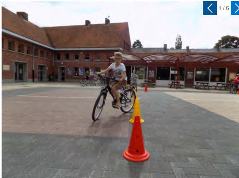
Kinderen uit het vierde leerjaar van de basisschool Albertstraat in Beerse (BAB) oefenen op de speelplaats fietsvaardigheden tijdens de Strapdag.

BEERSE - De leerlingen van de gemeentelijke basisschool Albertstraat in Beerse namen vrijdag ook deel aan de Strapdag. De kinderen kwamen zo veel mogelijk met de fiets of te voet naar school.