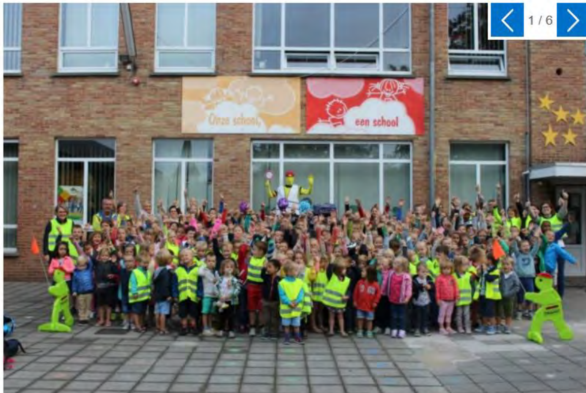
VBS Aaigem

ERPE-MERE - Ook in onze basisscholen was het vandaag Strapdag (staat voor 'stappen of trappen').