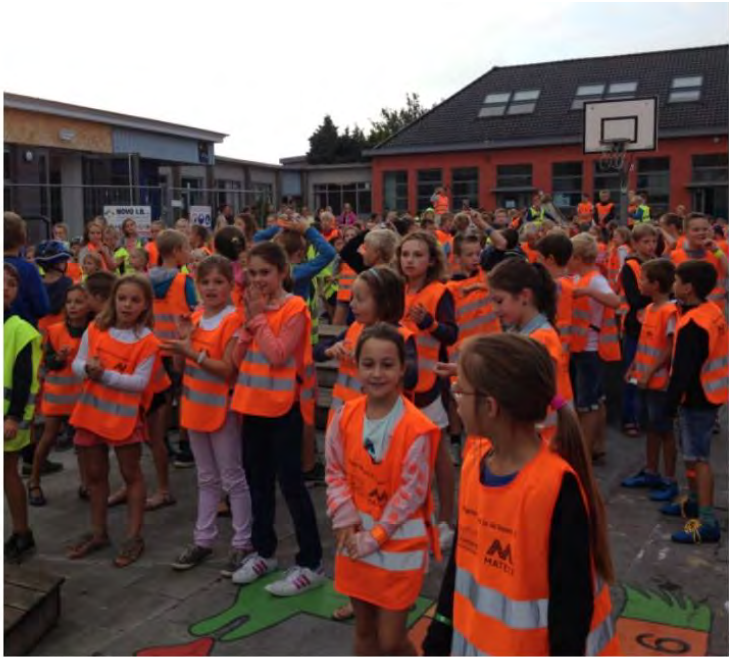
De VBS maakte men er een heuse happening van, en zette men de dag in met zang en dans van het straplied